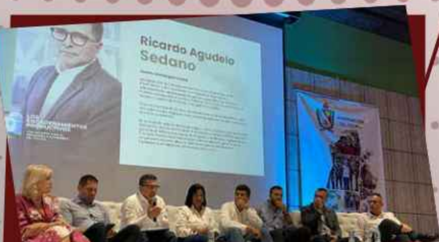
Conversatorio regional del sector minero energético, "Los encadenamientos productivos una apuesta para el desarrollo sostenible del Tolima".