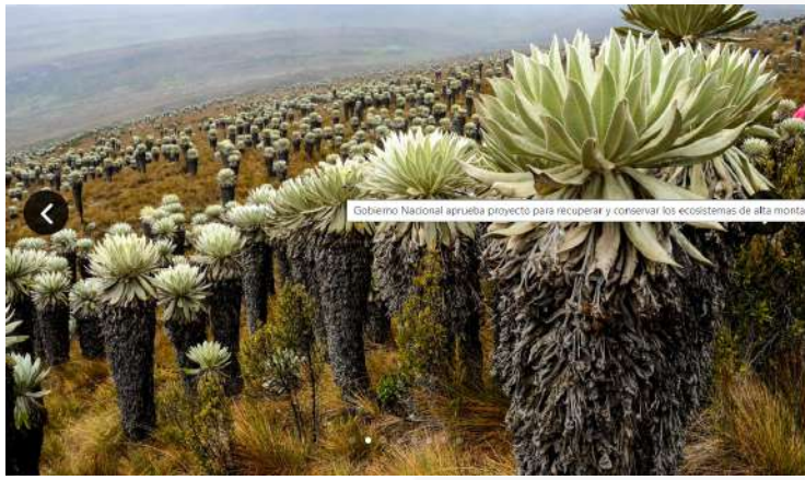
Gobierno Nacional aprueba proyecto para recuperar y conservar los ecosistemas de alta montaña de la Región Central