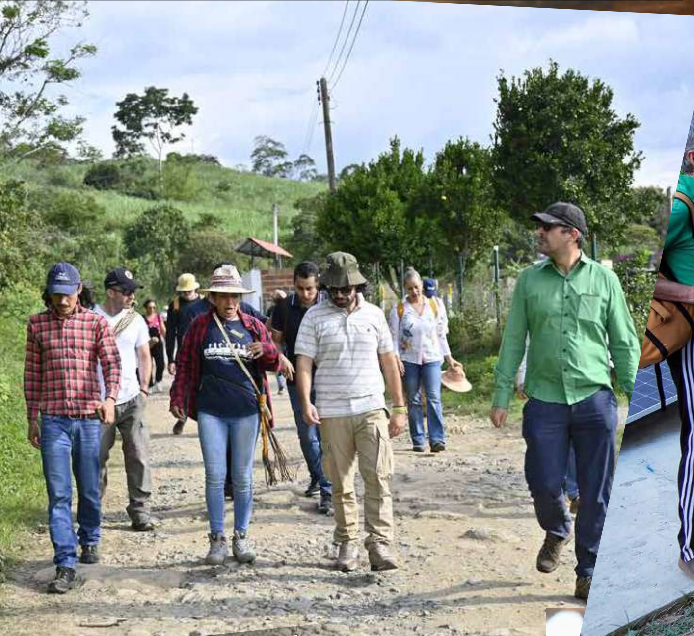
San José de Pare-Boyacá